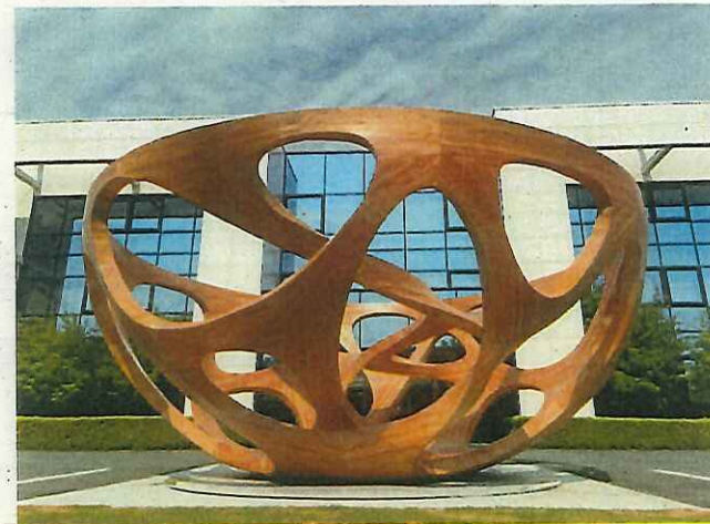
FREE WOOD（木材の3次元設計・加工）