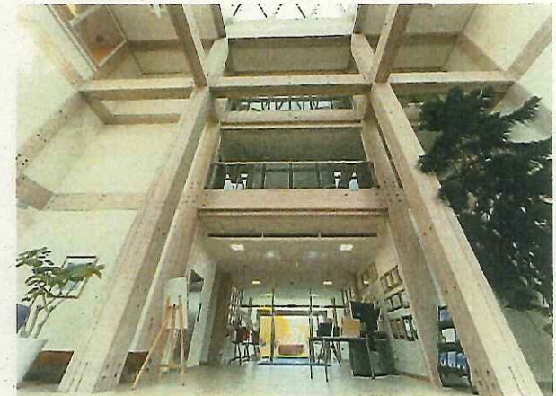
1階エントランスホール（2021年11月撮影）