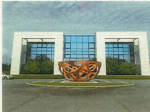
外観正面（2022年7月撮影）